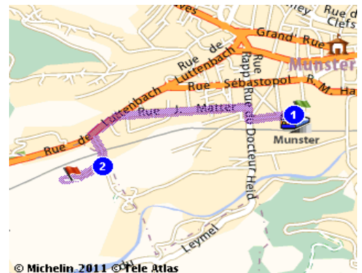
1 Gare de Munster 2 ODCDL La Fermeaie